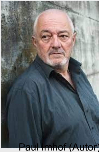
Paul Imhof (Autor)