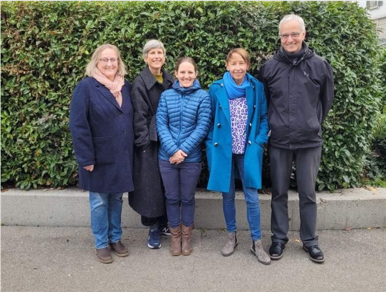
Zusammensetzung des Vorstands von 2020 bis Dezember 2024