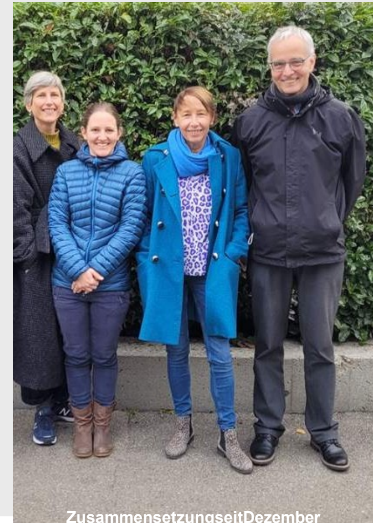
Zusammensetzung seit Dezember